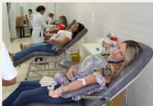
Alunas doando sangue e equipe do Hemocentro.

Estamos completando neste ano o nosso 24º trote solidário, com 12 anos de atividades, que dividimos em várias ações. Começamos com a doação de sangue em parceria com o Hemocentro de Catalão; com uma coleta expressiva de doadores, incluindo alunos, professores, colaboradores e comunidade. Em seguida realizamos a arrecadação de alimentos não perecíveis, com a participação de todos os alunos dos nossos cursos de Administração, Ciências Contábeis, Direito, Sistemas para In-