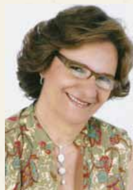
Cleuzadir Coordenadora Geral FENOVA

Foi um grande empreendimento de vida ter estudado no CESUC. Concluí o Curso de Direito e o balanço positivo principal desta trajetória é a capacidade adquirida no âmbito da ampliação de horizontes para assimilar novos conhecimentos.