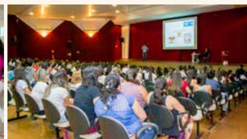
Palestra - Novembro Azul

O câncer de mama e o de próstata se diagnosticados precocemente, a doença tem 90% de chance de cura. Adotar um estilo de vida mais saudável tam-