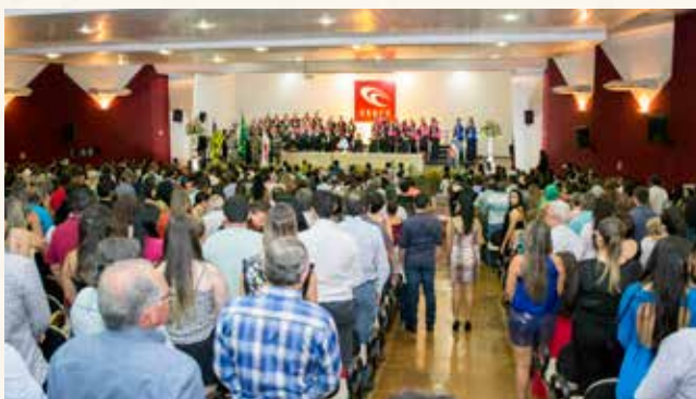
Formandos de Direito, Ciências Contábeis e Sistemas de Informação