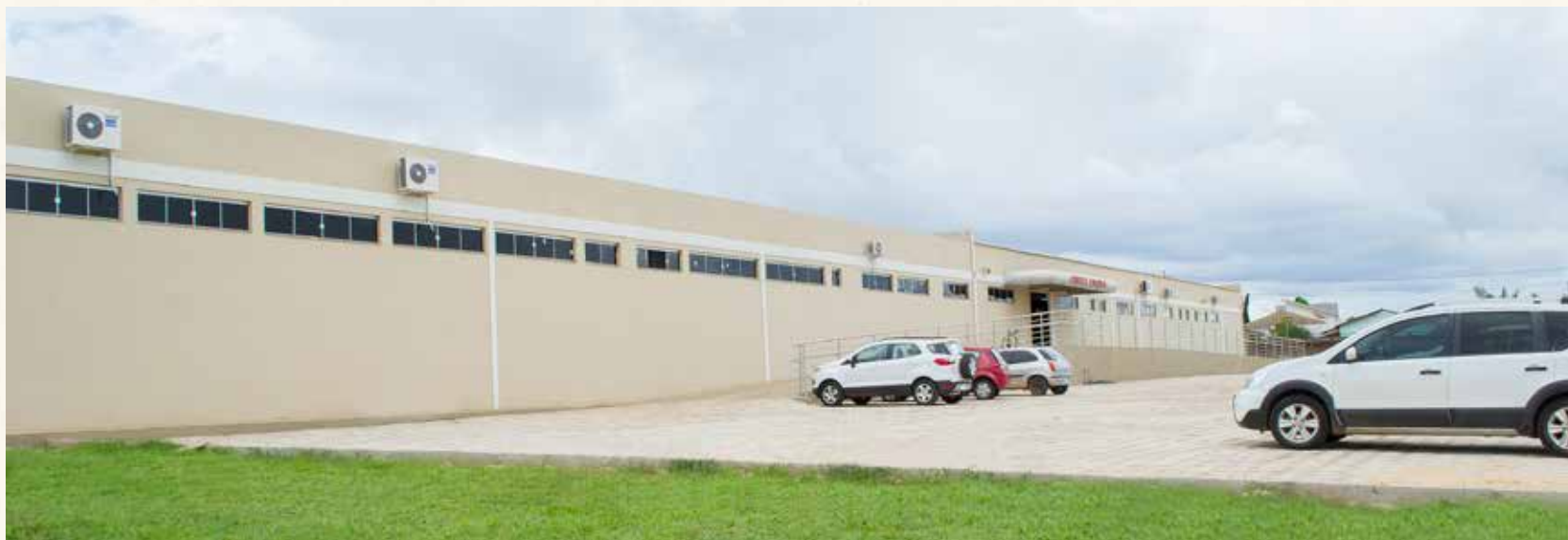
Clínica Escola do CESUC

Ampliação da Clínica de Fisioterapia e a criação da Clínica de Psicologia