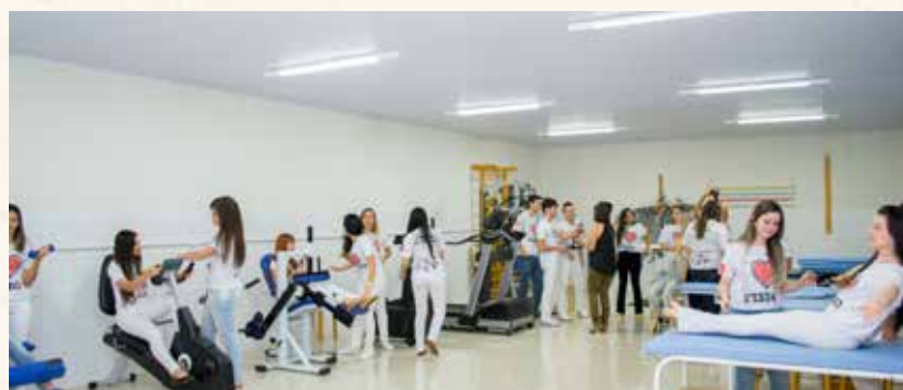
Clínica de Fisioterapia

A Clínica Escola de Fisioterapia tem sido referência em atendimento. Foi criada para aprimorar o conhecimento dos alunos durante a sua graduação, com aulas práticas e, no último ano do curso, no estágio supervisionado, são ministradas atividades práticas obrigatórias com atendimentos, sempre acompanhadas pelos professores, para a conclusão do curso.