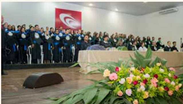
Formandos de Administração, Logística e Fisioterapia

Com belíssima decoração, muita alegria, sorriso de felicidade espalhado por todo o auditório, aconteceram as formaturas de 2016.