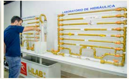
Laboratório de Hidráulica e Fenômenos de Transportes