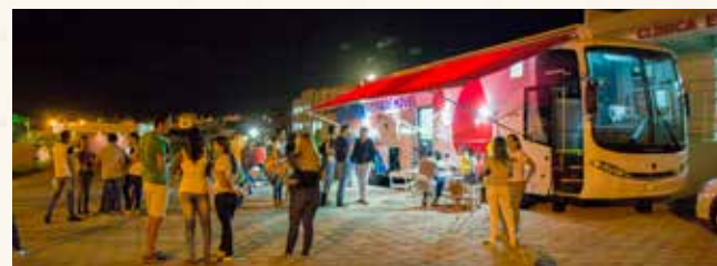
Hemocentro Móvel de Catalão

Essa ação se estendeu aos demais alunos da comunidade catalana que, sensibilizados participaram da doação. O evento é de fundamental im-