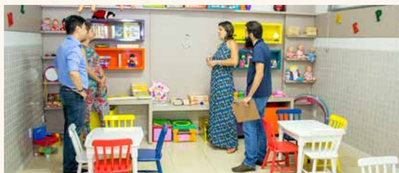
Visita dos membros do Conselho de Psicologia

Foi inaugurada no dia 27 de outubro de 2016 a Clínica de Psicologia. As pessoas presentes tiveram a oportunidade de conhecer uma obra de grande relevância para a cidade de Catalão e região.