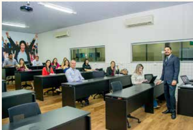
Novas Salas de Pós-graduação