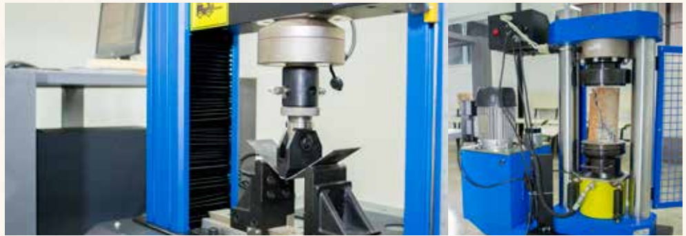
Laboratório de Resistência dos Materiais