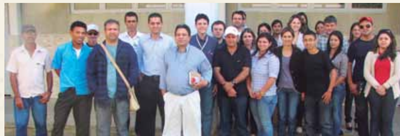
Colaboradores e Palestrantes.

O CESUC realizou mais um encontro do Programa de Aperfeiçoamento Docente - PAD. O X módulo do Programa, aconteceu no dia 30 de julho com o tema: "A utilização dos recursos audiovisuais e a aplicação do TCC na sua prática".